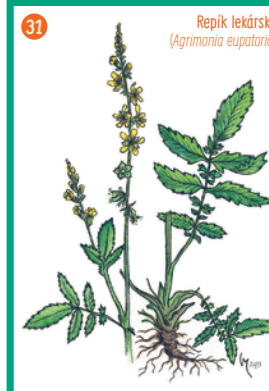
Repik lekársky ( Agrimonia eupatoria )