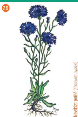
Nevädza pohád ( Centaurea cyanus )