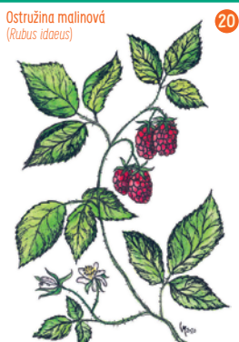
Ostružina malinová ( Rubus idaeus )