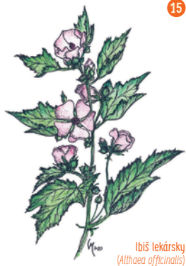
Ibiš lekársky ( Althaea officinalis )