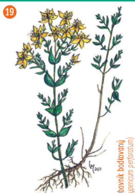
Ľubovník bodovavý ( Hypericum perforatum )