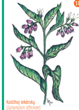
Kostihoj lekársky ( Symphytum officinale )