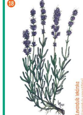
Levandula lekárka ( Lavandula angustifolia )