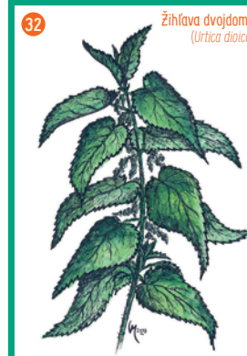
Žihlava dvojdomá ( Urtica dioica )