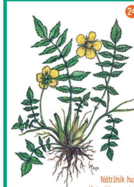
Nátržník husí ( Potentilla anserina )