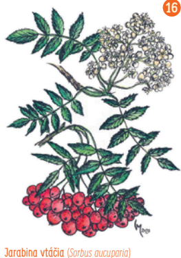
Jarabina vtáčia ( Sorbus aucuparia )