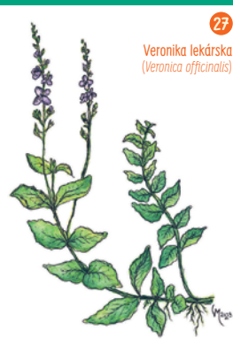
Veronika lekárka ( Veronica officinalis )